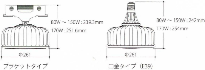
ブラケットタイプ