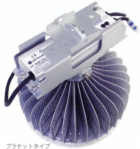
ブラケットタイプ